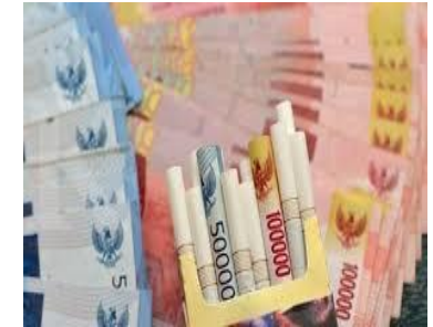
DATA PRODUKSI (batang)